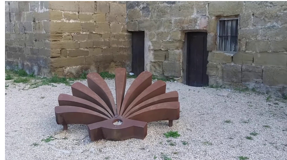
Murallas del pueblo.