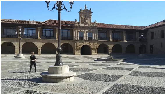
Ayuntamiento de Santo Domingo de la Calzada.