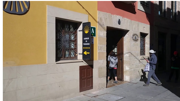
Albergue de peregrinos.