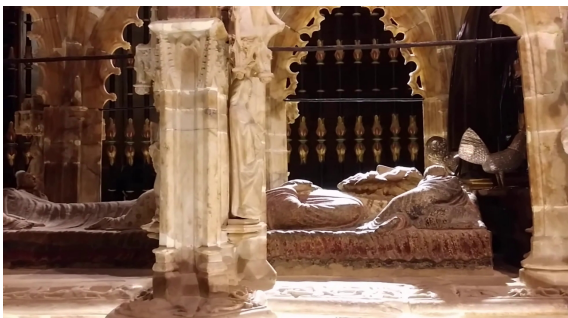
Sepulcro de Santo Domingo.