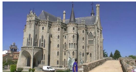
Astorga, Palacio Episcopal de Gaudí.