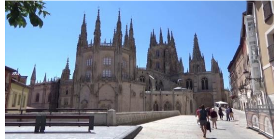
Catedral de Burgos.