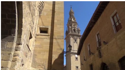
Catedral de Santo Domingo de la Calzada.