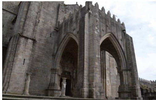
Catedral de Tui.