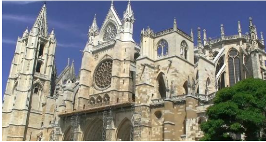
Catedral de León.

El patrimonio arquitectónico del Camino de Santiago es muy valioso. Las ciudades que se encuentran en los distintos caminos construyeron impresionantes catedrales para que los peregrinos se detuvieran en su recorrido y las visitaran.