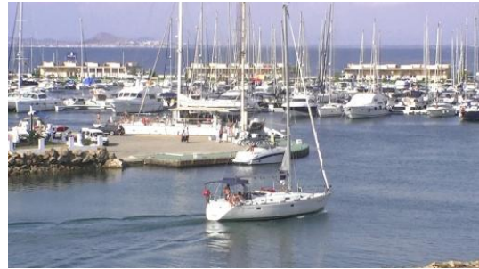
2. ¿A dónde vuelve el barco?