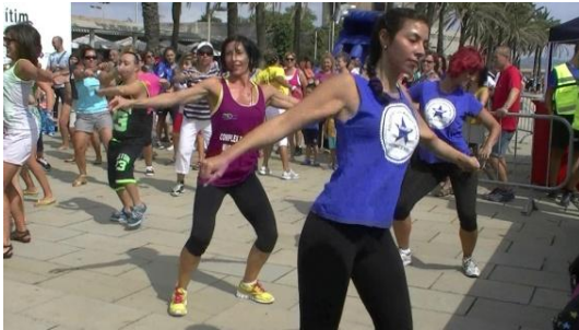
1. ¿Qué mueven ?