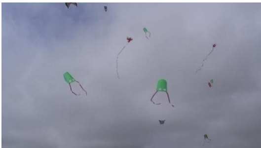
3. ¿Dónde vuelan las cometas?