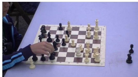
8. ¿A qué juegan ?