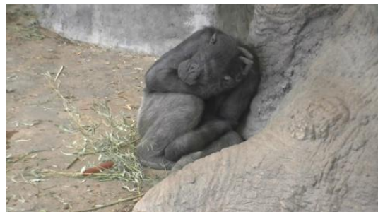
4. ¿Por qué duerme el mono?