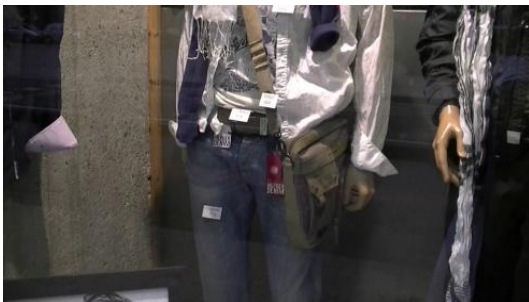
5. ¿Cuánto cuesta el pantalón?