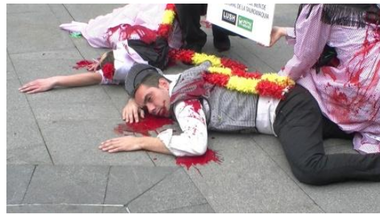
6. ¿Dónde muere el hombre?