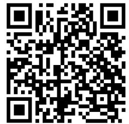
Para ver el vídeo

4 Identifica en el vídeo las palabras anteriores.