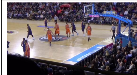
c. Vuelve a fallar.