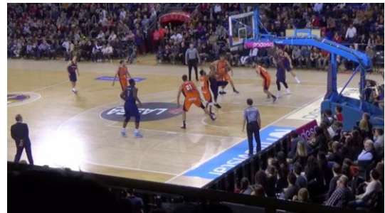
b. El jugador número nueve va a lanzar el balón.