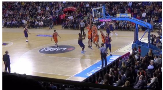
d. Lo lanza pero falla.