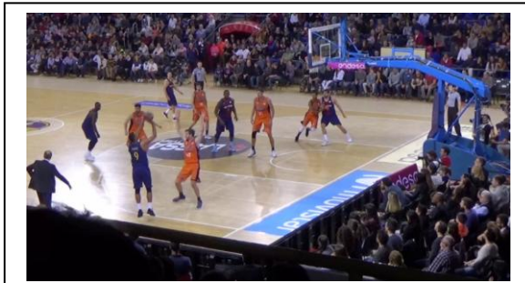
a. Vuelve a lanzarlo.